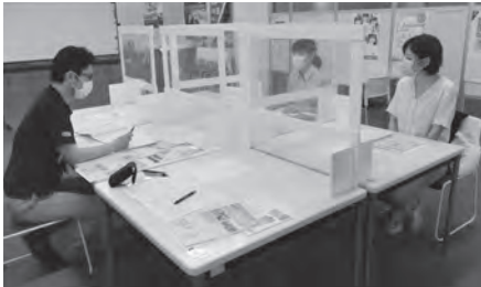
オリエンテーションの様子