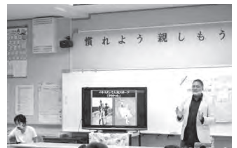
小学校でのパキスタンの授業

当センターは、今年、設立30周年を迎えました。今後も地域のために積極的に活動していきます。