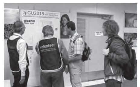
国際会議で活動する語学ボランティア