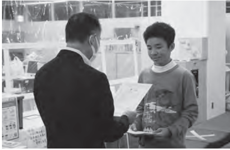
記念品と賞状の授与