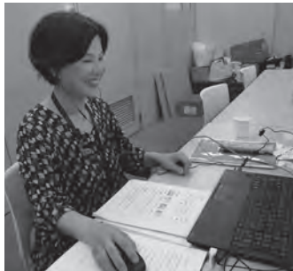
はじめての韓国語 9月17日~全6回