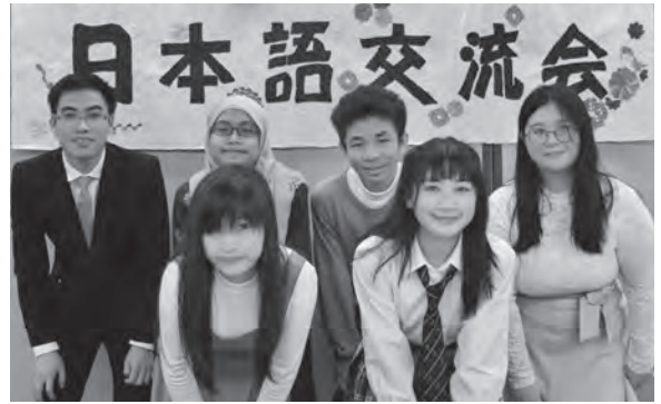
発表者のみなさん