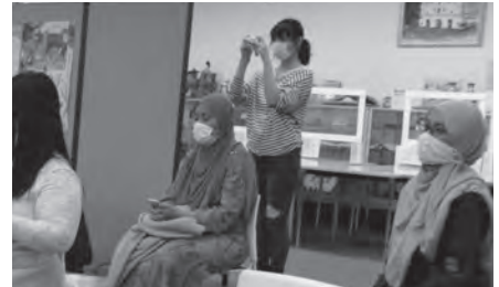
記録用写真の撮影