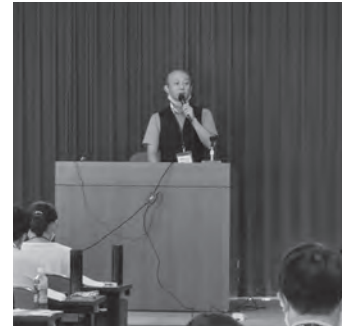
千葉市役所新規採用職員等を対象に多文化共生について講義