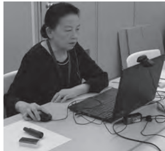
はじめての中国語 10月6日~全6回