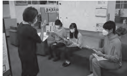
日本語交流会の説明を受ける交流員