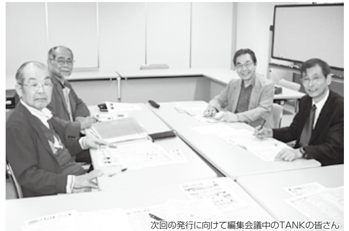
次回の発行に向けて編集会議中のTANKの皆さん

TANKは参加した人の頭文字からとりましたが、仲が良いこのグループが長く続くことを願っています。それぞれが、積極的にこの活動に参加して、忙しい中でも愚痴をこぼさないのが素晴らしいと思います。何事もぶち破るタンクの勢いで、これからも前向きに進んでいきます。