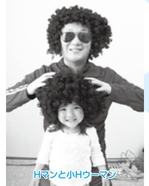
Hマンと小Hウーマン

変わったことといえば、お腹周りが大きくなったことと、小Hウーマンができたことである。