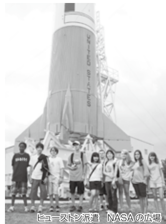
ヒューストン派遣 NASAの広場