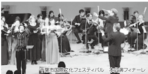
千葉市国際文化フェスティバル 本公演フィナーレ