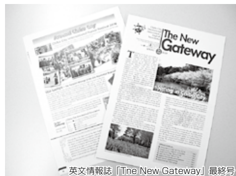
英文情報誌「The New Gateway」最終号