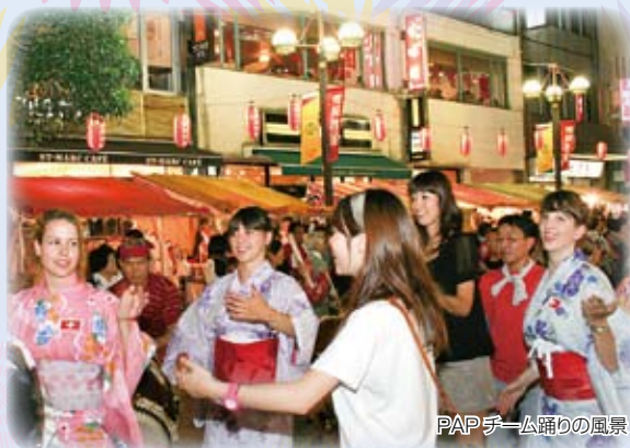
PAPチーム踊りの風景