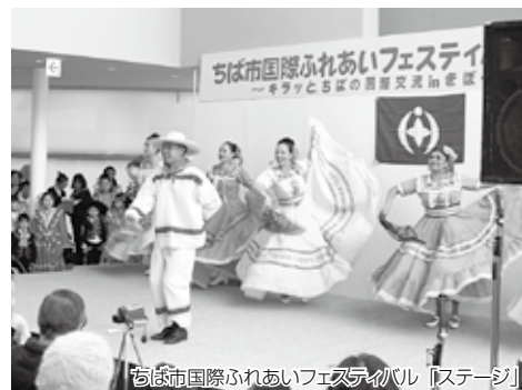
ちば市国際ふれあいフェスティバル「ステージ」