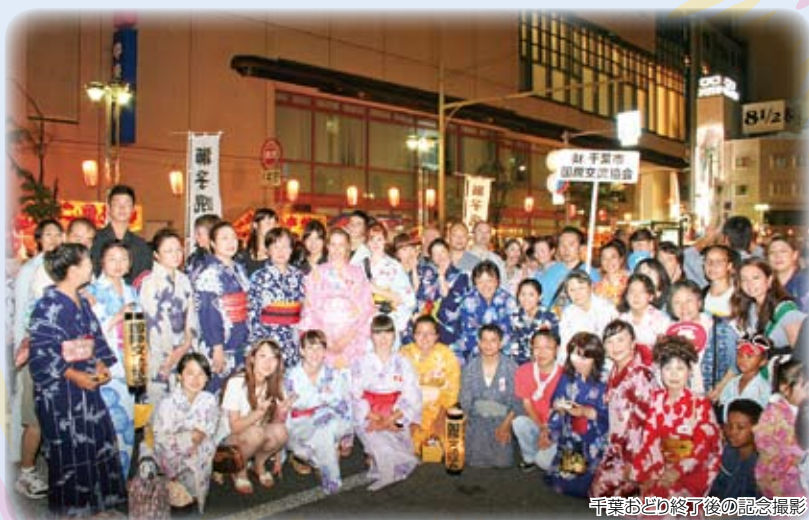
千葉おどり終了後の記念撮影