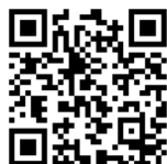
かいじょう ちず 会場の地図