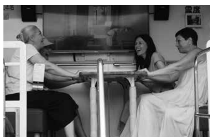
震度7の地震体験に驚くウクライナの方々