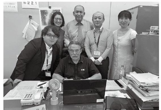
ジョージさん当国際交流協会 訪問時

新型コロナのため、互いの都市を訪問する交流は一旦途絶えていましたが、今でもこうして続く両市の交流を協会として嬉しく思います。