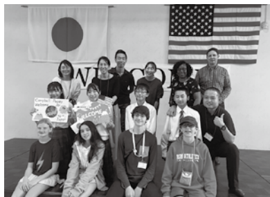
ホストファミリー皆さんと記念撮影