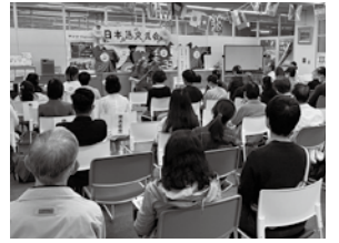
日本語交流会の会場風景