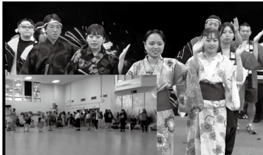
カナダと日本で同時に千葉踊り