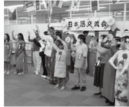
グランドフィナーレ