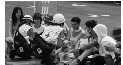
被災者役の外国人

また、参加した外国人の皆さんに食料備蓄の大切さを学んでもらうため、帰り際には災害用非常食をプレゼントしました。