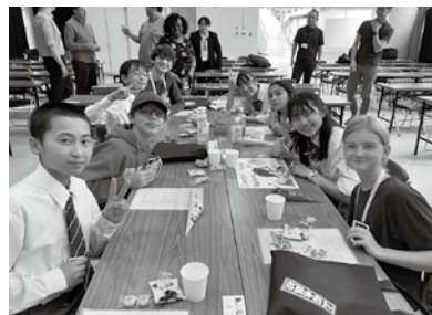
中学生同士で楽しく交流