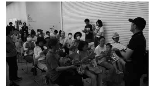
外国人向け防災教室