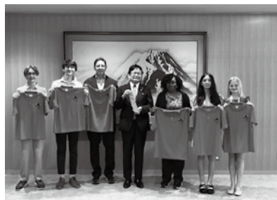
千葉市長表敬訪問