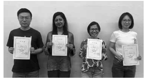
留学生交流員の任命書を手にした4人

千葉市外国人留学生交流員4人は、市や協会の様々な事業に積極的に参加・協力してくれています。