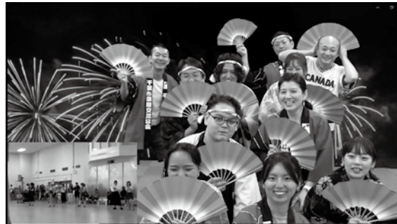
千葉踊り 扇子でフィニッシュ!