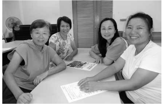
グループ学習クラスに楽しそうに参加している様子