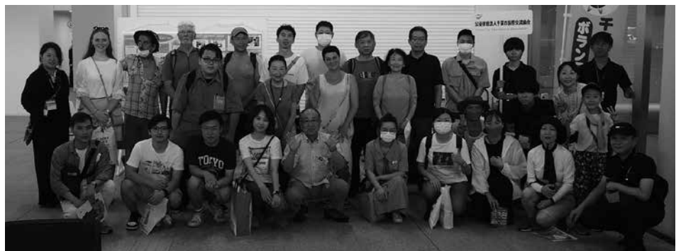
訓練後の集合写真