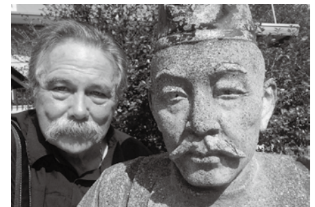
千葉常胤像とジョージさん 似てる?