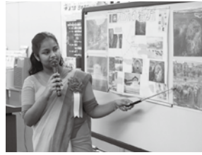
日本語スピーチ発表の様子