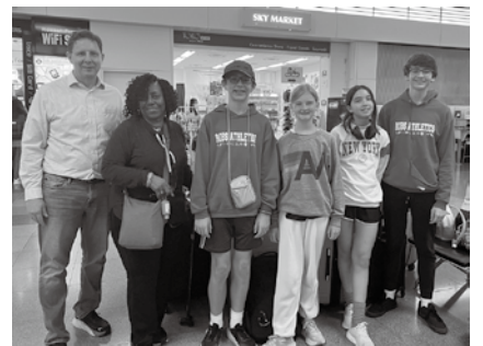
ヒューストン市からの来業者6名