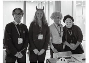
職員も仮装しました!