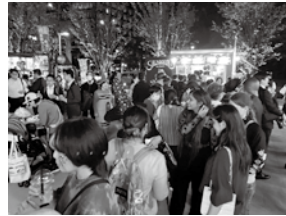
多くの方で賑わう会場の様子