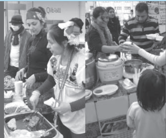
中南米料理やインド料理など(昨年)