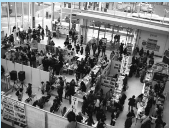
「ふれあいフェスティバル」会場内の様子

なお、このフェスティバルでの売上金(バザー、飲食など)の一部は、チャリティーとして「タイ舞踊同好会」を通して「タイ洪水被害救済のための寄付金」として寄付されます。