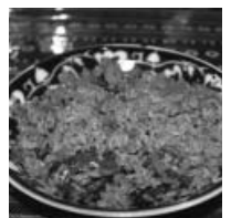
写真は、ウルムチ美食ランキング1位を獲得したレストラン「五月花」のポロ

お米に、羊肉と人参などの野菜を入れて作る。干し葡萄を入れれば、ウイグル族のご馳走の完成!