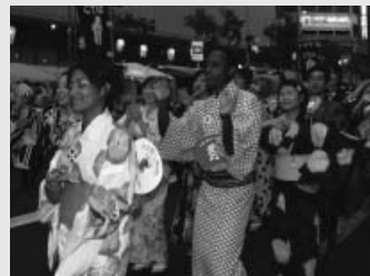
親子三代夏祭り「千葉踊り」

8月21日(日) 日本人市民と外国人市民によるPAPチームを結成し、親子三代夏祭りに参加しました。当日は雨が降っていたので、開催が心配されましたが、千葉踊りの際は雨もほとんど止み、皆で楽しく交流を深めることができました。