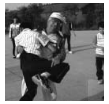
生徒と本気で相撲