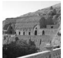
それぞれの洞窟の中に壁画が残っている

火焰山山中にある仏教石窟寺院跡。6世紀から石窟の開削が始まり、元代までの約700年間造り続けられた。石窟内には多くの仏像や壁画があったがこの地にイスラム教が浸透するようになると破壊され、さらに20世紀初頭には外国人探検隊により盗みとられてしまった。