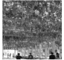
葡萄溝のブドウ棚

トルファンの葡萄と言えばあまりにも有名。人口約27万人のトルファンで中国の約3/4の干し葡萄が作られている。葡萄溝は、トルファン中心部から北東13kmに位置する渓谷にある。そこにはブドウ棚約20haが広がっており、シルクロードのオアシスを実感できる場所だ。