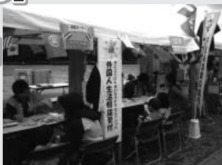
協会ブースの様子(美浜区)