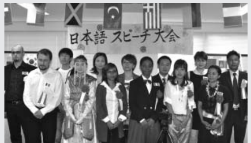
「日本語スピーチ大会」の発表者の皆さん

ボランティアの方々が日本語スピーチ大会運営委員となり、企画・準備が行われ実施されました。今回は10カ国13名の方が様々なテーマをもとに日本語でスピーチをしました。