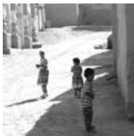
吐峪溝の子どもたち

ウルムチは首府だけあって高層ビルが立ち並ぶ都会であったがウルムチから東に約180kmにあるトルファンへは、バスで2時間半ほど。トルファンにはシルクロードらしい風景が広がっていた。