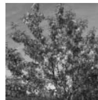
校内では花が咲き 乱れています