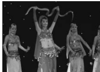
ウルムチのディナーショーで見たウイグル族の踊り これって中国?

かつてのシルクロードの地、新疆ウイグル自治区を訪れて感じたのは、中国であっても中華圏ではないということだ。ハンマンは中国には何度も、そして様々な地域にも訪れたことがあるのだが、新疆はそのごとも大きく違っていた。宗教はもちろん、人種、言葉、文化、食事の全てが違うのである。しかし、日本の約25倍の面積を擁する中国であることから、日本人の感覚では理解できない部分も多いのも事実。違った人種、言葉や文化を持つ人々が混在して生活している(まさに多文化共生社会)のが中国だと実感した旅であった。