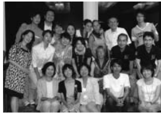
▲ お別れパーティにて記念撮影

8月4日(木)～8月13日(土) 青少年2名 引率者1名 千葉市の一般家庭にホームステイしながら、千葉市役所表敬訪問、市内見学や、日本文化体験などをしました。