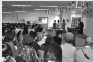
運営委員長による主催者挨拶