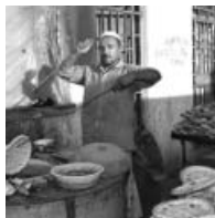
トルファンの街角でナンを売るおじさん