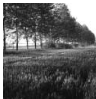
「天真園」周りの ポプラ並木

場所は、天津市清武区にあり、北京空港から高速道路で約1時間、 天津市の中心部から車で約1時間と、北京・天津のほぼ中間に位置 しています。