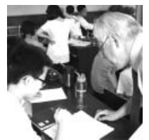
日本語の授業風景