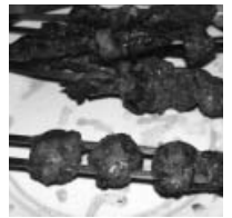
羊腰肉も美味しいよ

羊肉なので焼鳥ならぬ焼羊。香辛料の聞いた串焼き。ビールに非常に合いそうなのだが、イスラム圏の新疆のレストランではアルコールであるビールは置いていない。うーん残念!