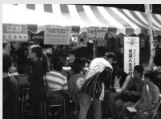
協会ブースには外国人が多く訪れ相談待ちも(中央区)