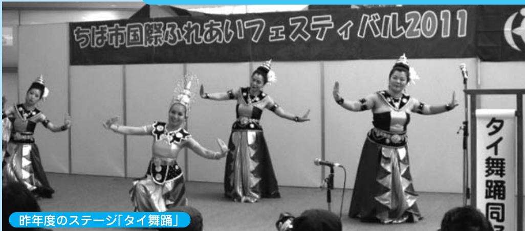
昨年度のステージ「タイ舞踊」