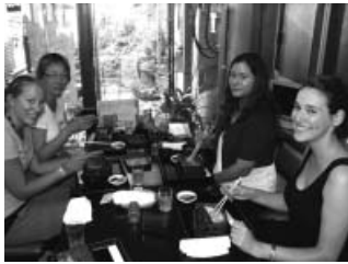
▲ 成田山にて鰻の昼食 (皆美味しいと言っていました)