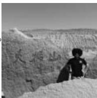
アフロヘアのハンマンには厳しい暑さの火焰山

西遊記にも登場する有名な灼熱の山。山肌の温度が80度になることもあるという。東西約100kmの長さがあり、玄奘一行のみならず、みな旅人はこの山に行く手を遮られる。ハンマンが行った時は、気温が50℃近くあった。サウナ以外でこんなに暑い体験をしたのは初めて。