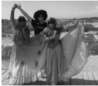
交河故域にてウイグル美女と