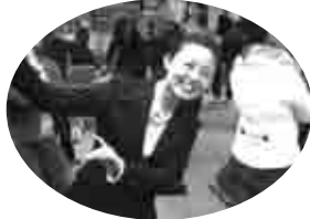
皆で楽しくネパールダンス

イベントの後半は、来場者の方々と一緒にネパールダンスを踊ったり、イス取りゲーム等を行ったりと、大変にぎやかなイベントとなり、互いの親睦を深めました。