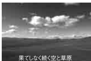
果てしなく続く空と草原