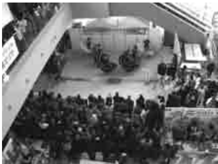
ステージ発表風景