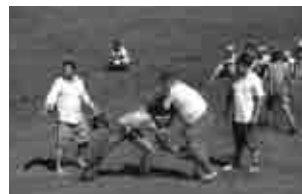
今や日本の相撲界を席卷するモンゴル相撲

モンゴルの文化 ：今でも国民の半数が遊牧民として生活する中、伝統的な芸術は持ち運びやすさや生活を維持するうえでの機能が重視