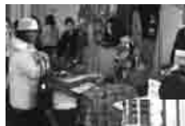
出展バザーの様子