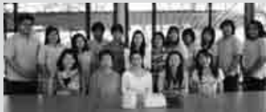
タイの大学生と一緒に

やはり、ワーリン先生による繋がりで。私たちのグループは、タイ王国で開催されるフェスティバルなどに参加し、タイの人々との交流を深めています。今年タイで30年以上続いているドーンジェーデー記念塔祭典とアユタヤ世界遺産祭りでタイ舞踊を踊りました。