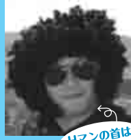
Hマンの首は 何処へ

読者の諸君こんにちは。 私事になるが、Hマンはただ今ダイエット敢行中だ！ 何でダイエット中かだつて？ 入社当時から比べると12kgほど体重が増えたからだが…何か？