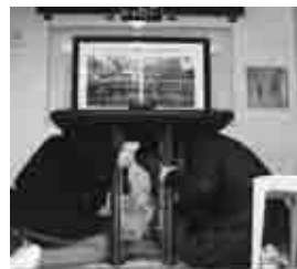
起震車での地震体験

外国人のための防災訓練を～助かるために、助けるために～をテーマに中央区役所及び千葉市防災普及公社と共働で、実施いたしました。寒い中にもかかわらず、約50名(内外国人約40名)の方に参加していただき、以下の内容を体験しました。