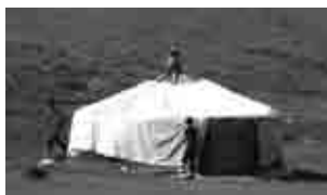
モンゴルの伝統的住居「ゲル」

モンゴルの自然 ：山や草原、砂漠や森もあってアドベンチャー好きな旅行者にとってモンゴルは一押しスポットだ。しかし気候は真夏でも変動が激しく、特に冬のウランバートルは地上最低気温が毎年記録更新されており、「世界で最も寒い首都」の一つとして知られている。真夏に行っても服は多めに準備した方が無難だ。ウランバートルからアクセスしやすいボグド・ハーン国立公園地域は特にお勧め。