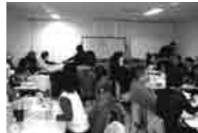
グループごとの意見交換の様子

訓練の最後には、内容のふりかえりとして、グループに分かれて意見交換をし、訓練を受けた感想や今後災害に備えておきたいことをグループごとに発表していただきました。