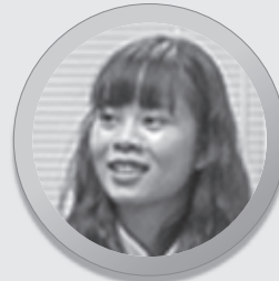
チさん 東京情報大学 ベトナム

交流員としての活動で、一番印象に残っているのは「ちば市国際ふれあいフェスティバル」です。そこでは司会を任せられ、僅かな時間ですが、ベトナムのことを紹介することができました。また、「ヒッポファミリークラブ」さんのステージでは、小さな子供たちと一緒に踊り、ゲームをして、とても楽しかったです。この日は、多くの国の方、多世代の方と交流することができました。本当に面白くて、楽しい1日でした。また、多くの団体の活動を知ることができ、勉強になりました。交流員としての活動期間はあと僅かですが、今後も千葉市に住む外国人の1人として、協会の活動に協力して行きたいと思っています。