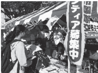
「中央区ふるさとまつり」にて

千葉市や関連団体が開催するイベントに出展し、協会の活動紹介やボランティア募集を行いました。