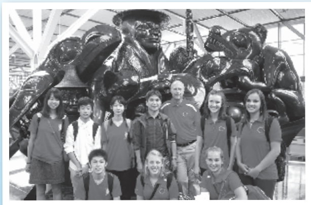
ノースバンクーバー市派遣

次代を担う青少年に姉妹都市の文化・歴史等について理解をしてもらうため、青少年交流事業を実施いたします。