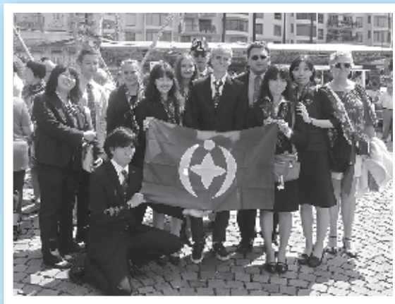
モントルー市派遣

日 時: 平成28年4月16日(土) ノースバンクーバー市 14:00 ~ 15:00 モントルー市 16:00 ~ 17:00 会 場: 千葉市国際交流プラザ(協会) ※地図は裏表紙参照 申 込: 本人が電話で予約 TEL 043-202-3000 (保護者の同伴は1人まで可) 受付期間: 平成28年4月1日(金)から4月14日(木) ※日曜日を除く 受付時間: 9:00 ~ 17:00