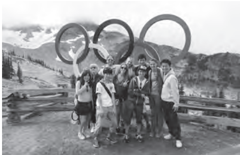
ノースバンクーバー派遣