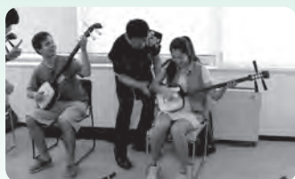
前回の交流会の様子