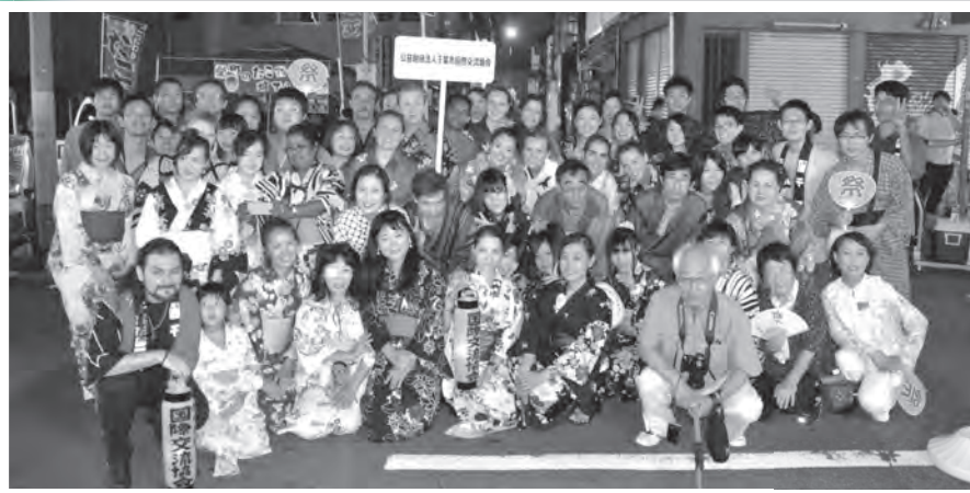
「千葉おどり」楽しいですよ！