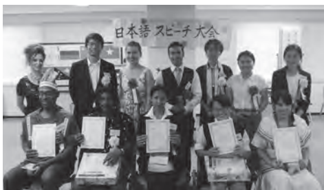
日本語スピーチ大会発表者の皆さん