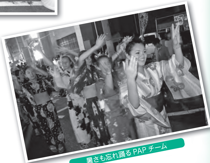
暑さも忘れ踊る PAP チーム