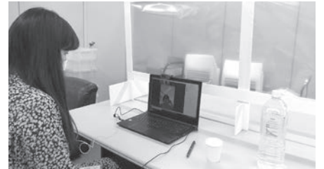
協会職員がオンラインで相談者と保健師の会話を通訳