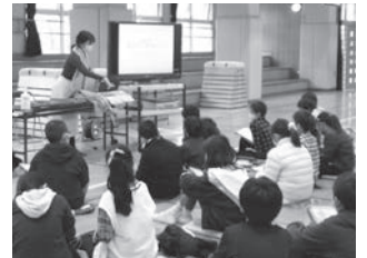
小学校で文化紹介