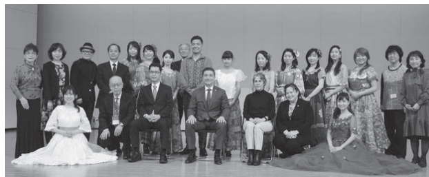
パラグアイ大使・出場者・関係者のみなさん