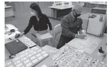
オンラインHUGの様子

※HUG: 避難者の年齢や性別、国籍やそれぞれが抱える事情が書かれたカードを、避難所の体育館や教室に見立てた平面図にどれだけ適切に配置できるか、また避難所で起こる様々な出来事にどう対応していくかを模擬体験するゲームのことです。H(hinanzyo 避難所)、U(unei 運営)、G(game ゲーム)の頭文字を取ったもので静岡県が開発しました。