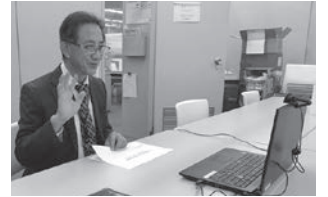
英語サロン(ベトナム文化紹介)