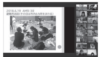
災害時語学ボランティア養成講座(オンラインで開催)

災害時語学ボランティア登録者を対象に、実際の災害時におけるボランティアの役割(外国人市民支援)等について学ぶ講座を実施しました。