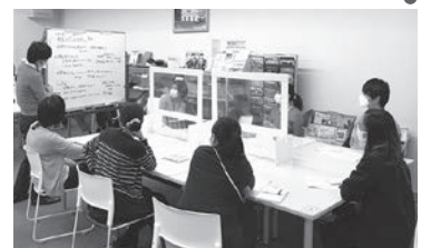
外国人市民懇談会打ち合わせに参加する交流員