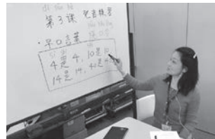
はじめての中国語