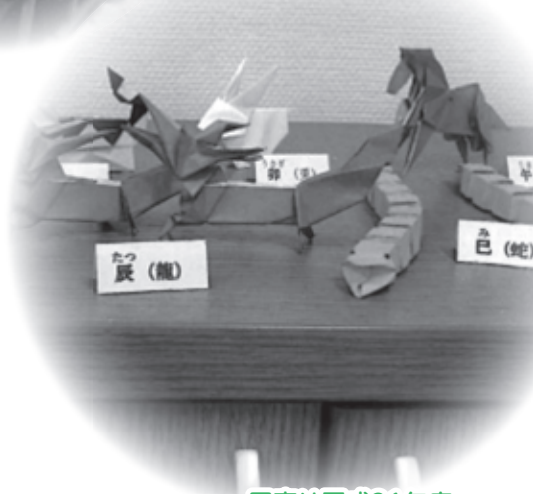
写真は平成31年度 助成事業報告書より抜粋