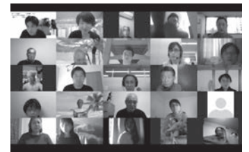
受講者全員と講師とのインタラクティブな講座

基本的な医療通訳の意義や活動上の留意点など、きちんと学んだのは初めてだったので、通訳としての関わり方や、団体の方向性など再確認する機会になった。通訳技術の向上のための具体的な練習方法がとても参考になった。