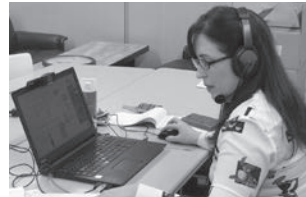
はじめてのスペイン語