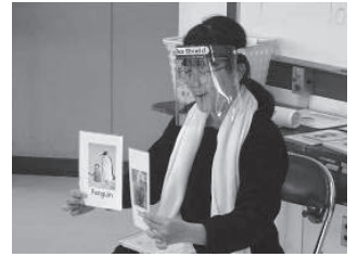
小学生向け英語講座