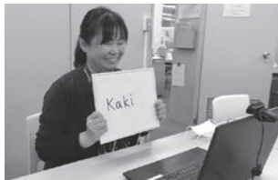
英語サロン(マレーシア文化紹介)