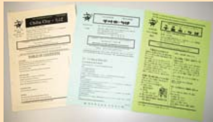
左から「英語」、「中国語」、「やさしい日本語」

有益情報満載だ！ 特に「やさしい日本語」は日本語学習にも最適。 ぜひ活用してくれ！