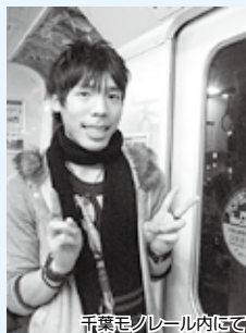
千葉モノレール内にて

千葉市のCIR(国際交流員)として早くも2年間が経ってしまい、そしてお別れの季節がやってきました。2年間千葉市役所内で勤務することが多かったのですが、協会の英語サロンでは、講師、あるいはアシスタント講師として何度か参加したことも貴重な思い出です。