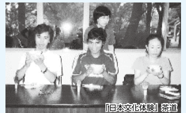
「日本文化体験」茶道

もしご興味のある方は、のぞいてみてください。（みんなの日本語 I & II の教授法を学んだことがある方）