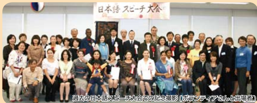
過去の日本語スピーチ大会での記念撮影(ボランティアさんと出場者)