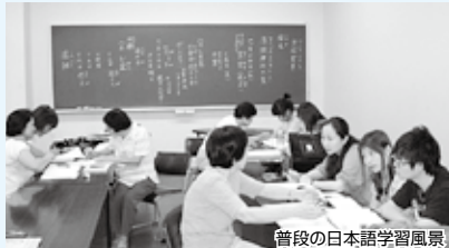
普段の日本語学習風景

活動内容：普段は日本語学習を主としているが、日本文化体験、校外学習、日本食材の調理の仕方を覚えるため、「日本料理教室」なども実施している。