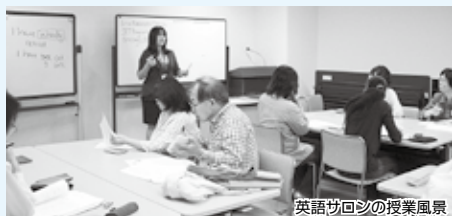
英語サロンの授業風景

5月18日から8月3日までの毎週火曜日に「世界の国や地域」をテーマに、英語サロンを行いました。