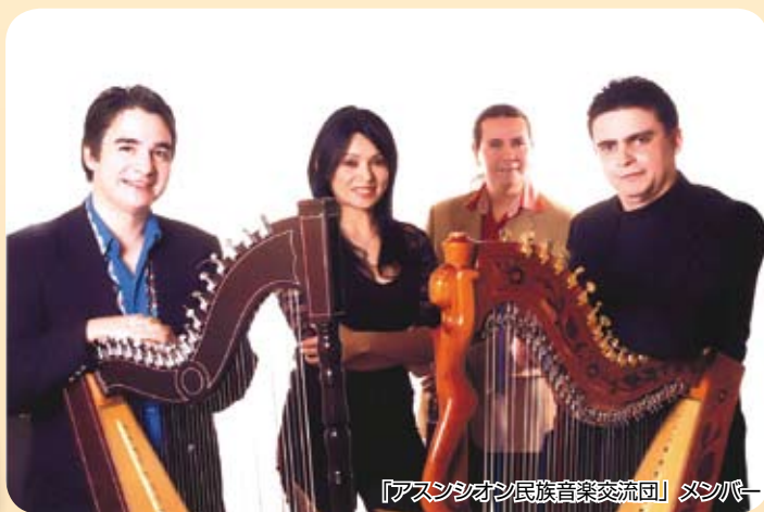
「アスンシオン民族音楽交流団」メンバー