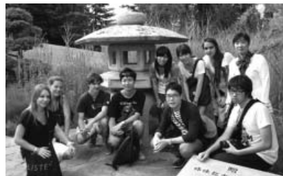
千葉市からモントルー市へ寄贈された石灯籠

ホームステイをしながら、モントルー近郊のさまざまな施設訪問や自然体験、モントルーの子供たちへ日本紹介をしました。