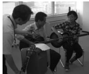
ブラジル音楽の紹介