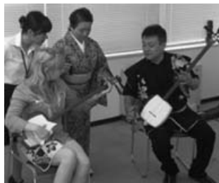
三味線演奏の体験