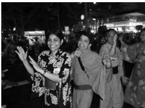
親子三代夏祭り「千葉おどり」

8月19日(日)日本人市民と外国人市民によるPAPチームを結成し、総勢105名で親子三代夏祭りに参加しました。千葉おどりで楽しく交流を深めることができました。