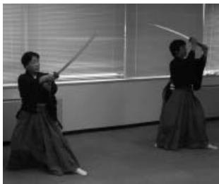
詩舞・剣舞の披露

今回は千葉市の姉妹都市ノースバンクーバーから青少年交流で来葉した高校生ら5人も参加し、中国、韓国、台湾、イギリスやブラジルなど10か国以上の方と日本人市民が交流を楽しみました。