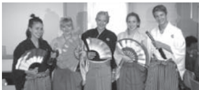
8月17日の交流会で。衣装体験