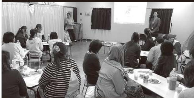
保護者の皆さんとの交流の様子

中国人児童の割合が4割を超える高洲第2保育所にて、中国人児童保護者と保育士を対象とした防災教室と交流会を実施しました。中国の方は、中国にて防災について学んだことがない方が多いとのことでしたので、今回防災教室を実施しました。また、中国人保護者と保育士さんとの交流会は、お互いの文化の違いの理解を図るために実施しました。