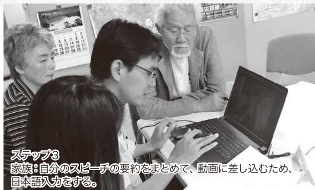
ステップ3 家族：自分のスピーチの要約をまとめて、動画に差し込むため、日本語入力をする。

ちば多文化協働プロジェクトの活動をWEBで紹介しています。 https://www.facebook.com/chibatabunka26 日本語クラスのスピーチとドラマはこちらからご覧いただけます。 http://chibatabunka.hatenablog.com/