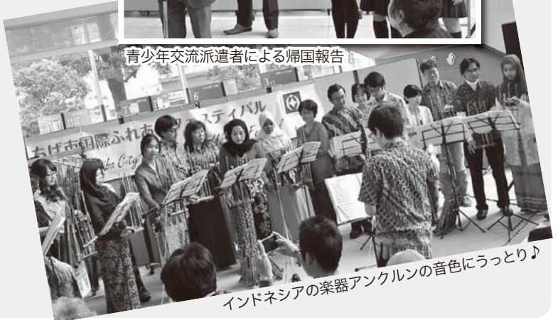
インドネシアの楽器アングルの音色にうっとり♪