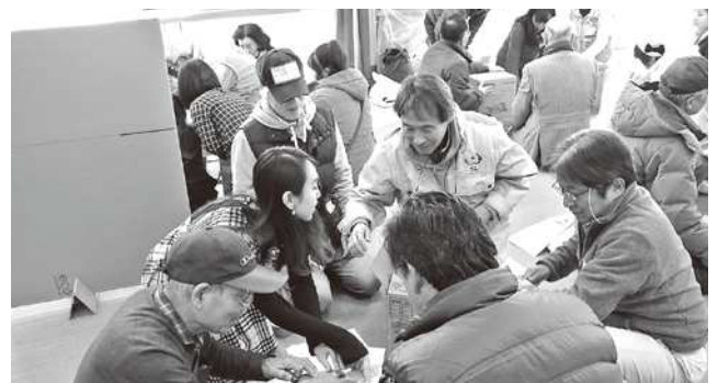
日本人市民と中国人市民とでグループで作業

多くの中国人市民が暮らしている千葉市美浜区高浜の公民館で、「防災」をテーマとした交流会を開催しました。ダンボールを利用した簡易トイレや間仕切りを作ったほか、「宝くじで1億円当たったらどうする？」などをグループごとに発表してもらい、防災に対する意識を高めるだけでなく、日本人市民と中国人市民との交流も深めました。