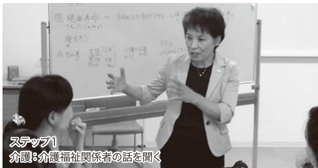
ステップ1 介護：介護福祉関係者の話を聞く

ちば多文化協働プロジェクトの一つとして、今年は生活と関わり深いテーマ6つ（趣味、家族、子育て2回、介護、防災、自治会）で、外国人住民の経験や意見などの声を発信してもらいました。テーマについて話し・聞き・読み・書いて、たのしい日本語学習となりました。