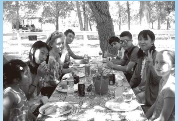
ヒューストン派遣