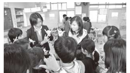
小学校にて文化紹介(胡交流員)

このようなイベントに参加すると、段々コミュニケーション力が強くなり、異文化も深く理解できます。協会のおかげで、このようなチャンスをいただき、本当に嬉しく思います。私も、小さな力ではありますが、千葉市に住んでいる日本人と外国人とが、もっと楽しく暮らせるよう、ボランティアとして様々な支援活動に参加したいと思います。そして、周りの困っている外国人に手を貸し、彼らが安心して暮らせるように頑張りたいです。