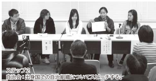
ステップ2 自治会：出身国での自治組織についてスピーチする。