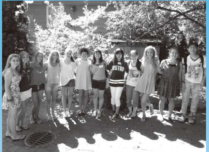
ノースバンクーバー派遣