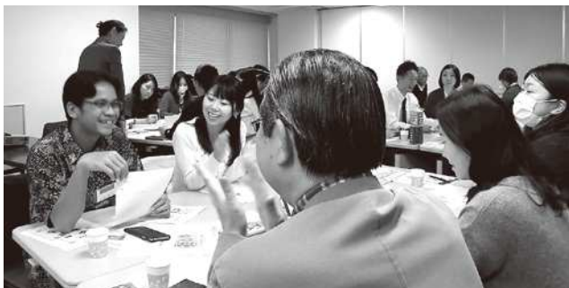
活発に意見を出し合うグループワーク

外国人住民と接する機会のある千葉市職員向けに「やさしい日本語ガイダンス」を実施しました。市職員の他、千葉市以外の自治体職員の方、“ちば市政だより”をやさしい日本語に翻訳しているボランティアグループ TANKの方や、外国人ボランティアの皆さんにも参加していただきました。外国人、日本人が交流しながら、明るく楽しい雰囲気で行われました。