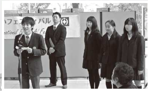
青少年交流派遣者による帰国報告

なお、今回のフェスティバルの売上金の一部及び皆様から頂いた寄付金は、ザンビアの会を通じ、今年で独立50周年を迎えるザンビア共和国に寄付されます。