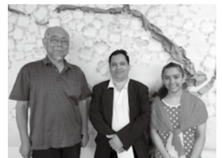
希望の桜の前で先生と親子と一緒に

日本語の勉強を始めたばかりの時は、難しくて「本当に私、話せるようになるの?」と全く自信がありませんでした。でも、先生はいつも“どう教えたら分かるか、覚えやすいか”と考えてくれました。教科の勉強もめげそうになったけど、先生が「もう日本に来ているのだから、しっかり勉強して日本での将来のことを考えなさい。」と励ましてくれました。勉強以外にも、千葉城でのお花見や動物公園散策に皆で行ったのが本当に楽しかったです。面接は苦手でしたが、今では自信を持って日本語で自分のことを話せます。次の目標は大学生になること、姉として弟のお手本になりたいです。