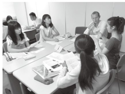
昨年度高校生通訳ボランティア通訳演習の様子