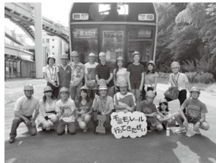
昨年度カナダ・ノースバンクーバー来業者 モノレール工場見学