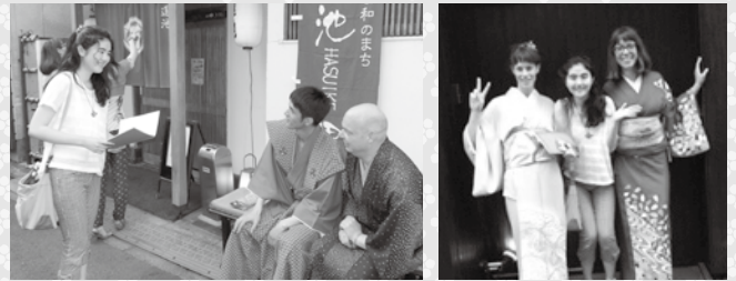
通訳活動を通して仲良くなりました!

本愛”が伝わって来て、日本、千葉が好き外国の方がもっと増えたらいいなと思いました。いつかもっと自然体で通訳ができるように頑張ります!これからもたくさん参加したいです。