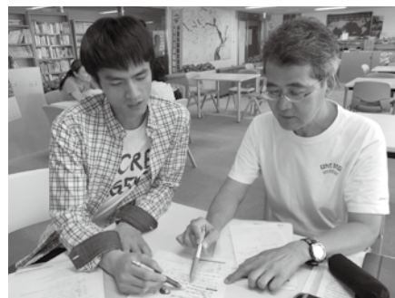
ボランティアコーディネート(日本語活動)