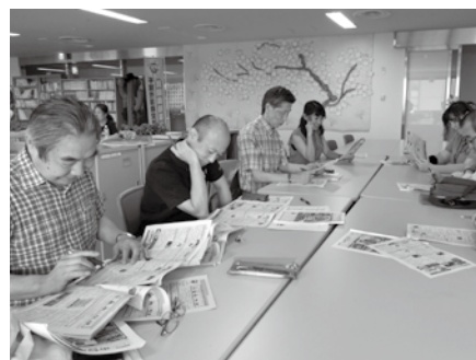
生活情報誌 入念に記事を選ぶ「TANKS」の皆さん