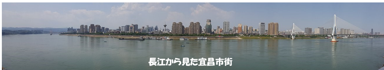
長江から見た宜昌市街

中国で日本語を学んでいる高校生と先生 計26人との交流会です。 日本語を使って話をしたり、日本の事を知りたいと思っている高校生ばかりです。 市内でできる国際交流ですので、ぜひご参加ください！