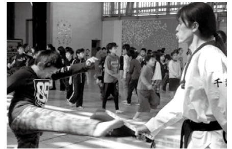
韓国文化の紹介とテコンドー体験会