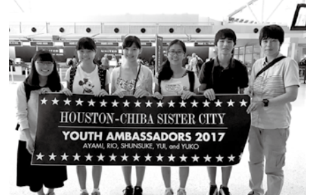
ヒューストン市との青少年交流