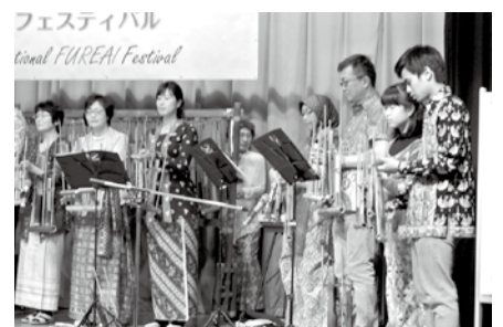
ちば市国際ふれあいフェスティバル