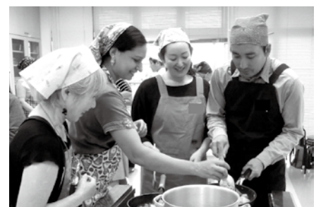
多文化理解セミナー いろいろな国のカレーをつくって食べよう!