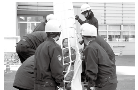
非常事態発生対応訓練(千葉都市モノレール)