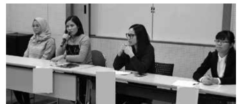
日本で働く外国人介護職員