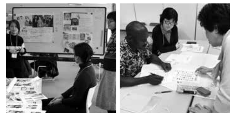
テーマでつながる日本語クラス