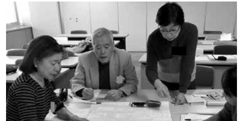
新基本講座 実践編