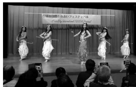
華麗なベリーダンスで魅了

今年は初めて市民会館で開催しました。千葉市内で活動する19団体が日頃の活動について披露しました。また、昨年の夏に千葉市の姉妹都市(カナダ・ノースバンクーバー市、アメリカ・ヒューストン市)に派遣された高校生、中学生が、その報告を行いました。なお、皆様から頂いた寄付金は、「千葉YMCA」を通じ、カンボジアの子どもたちの教育等のために役立てます。