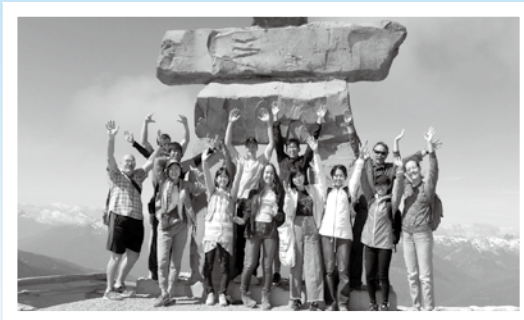
ノースバンクーバー市派遣