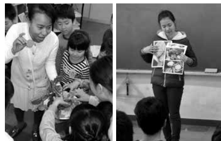
タイの美しいカービングアート紹介