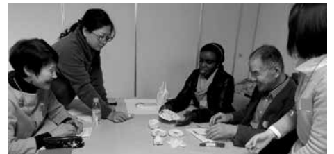
多文化理解セミナー