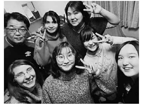
受入家庭の皆さんと笑顔で一緒に