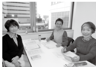
翻訳に取り組む皆さん〜華のような笑顔で〜

ハナの会の皆様、いつもありがとうございます。これからもよろしくお願いいたします!