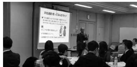
やさしい日本語の紹介と説明