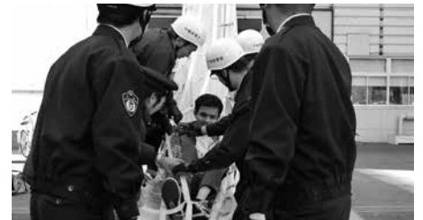
脱出シュートでの避難訓練