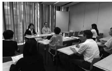
EIVOCIによる東京SGGクラブ視察の様子(リーダー会議で情報共有)