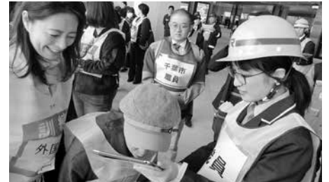
通訳アプリを使った避難誘導

地震災害時の電車不通により、千葉駅にいる帰宅困難者の中に外国人(英語圏、中国語圏)がいることを想定し、避難場所までスムーズに誘導できるような訓練を実施しました。