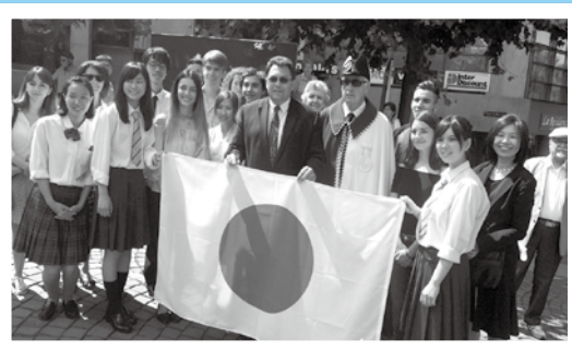
モントルー市派遣