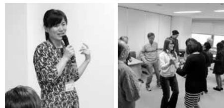
中国語サロン講師

当協会の外国人スタッフが講師となり、コミュニケーションに役立つ会話表現や文化紹介をしました。