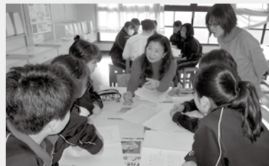
学校にて楽しく韓国文化を紹介

最後に、千葉を訪ねてくる韓国人にお勧めの場所は、海と花と一緒に楽しめる「稲毛海浜公園」です。