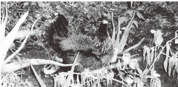
放し飼いの鳥の親子が畑を散歩

大都市ハノイ、ホーチミンを離れるとすぐ農村地帯だ。田舎育ちの私の原風景である。住まいには土間があり、鶏や犬は放し飼い、牛が水田を耕す光景を、バスから食い入るように見つめ、しばし少年時代にタイムスリップした。