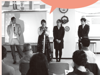
交流員が自国紹介や パフォーマンスをします

申込方法 窓口、電話、FAXまたはE-Mailで ①氏名(フリガナ) ②国籍 ③お住まいの区や市をお知らせください。