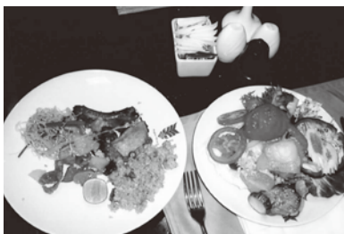
とても新鮮でおいしかった野菜。カリフラワー、いんげん、パプリカなどを毎日、たくさん食べた。

市場や市街の路上では、たくさんの種類の野菜、香草、果物が所狭しと置かれている。日本ではお目にかかれないミルクフルーツ、ドラゴンフルーツなどのトロピカルフルーツや葉菜も多くあり、目を楽しませてくれた。朝食バイキングの食卓にも豊富に並べられ、野菜、フルーツ大好き人間の私には、何よりのご馳走だった。