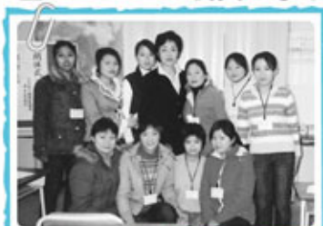
日本語教師資格取得後、初めて指導した学習者の皆さんと(後列中央:本人)