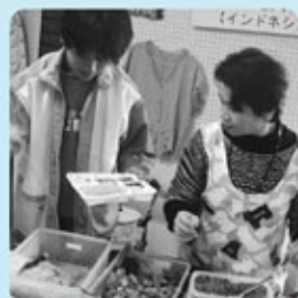
インドネシア料理の販売

チャリティーは、今年度は「ザンビアの会」を通して、アフリカ・ザンビア共和国のストリートチルドレンのための施設に寄贈されました。ご協力どうもありがとうございました。