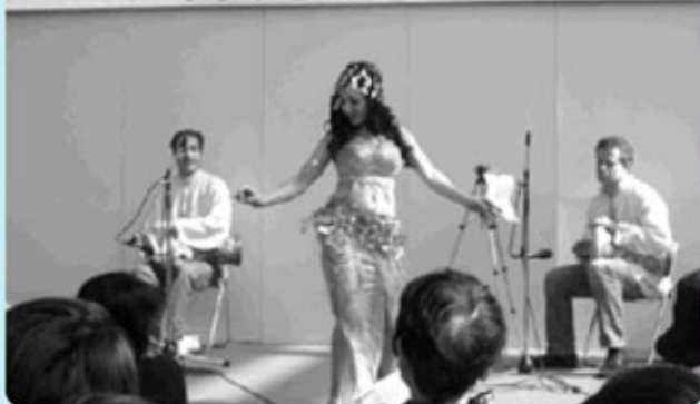
ベリーダンス披露

チャリティーは、今年度は「ザンビアの会」を通して、アフリカ・ザンビア共和国のストリートチルドレンのための施設に寄贈されました。ご協力どうもありがとうございました。