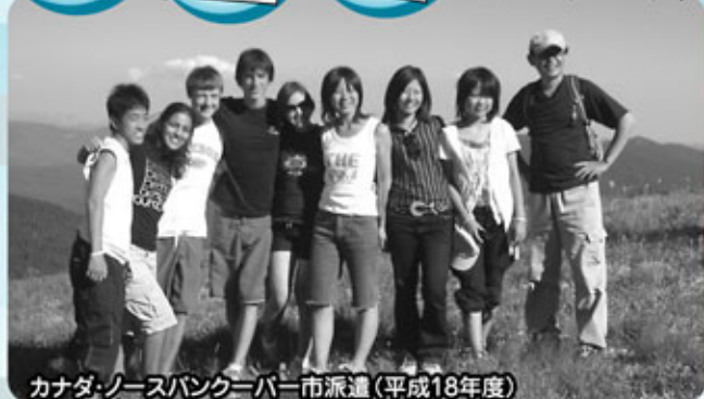
カナダ・ノースバンクーバー市派遣(平成18年度)