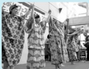
アフリカダンス披露