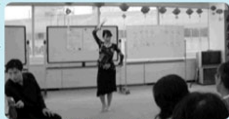
中国少数民族の「鳳凰の舞踊」披露

平成19年1月20日(土)午後1時30分から2時間にわたり、千葉市国際交流プラザ会議室で、中国と日本の正月についての紹介をしました。外国人40名を含む78名が参加し、胡弓演奏や太極拳演舞を楽しみ、福絵やしりとゲームをしながら交流を深めました。