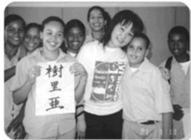
ドミニカ共和国の公立中学校訪問(右から3番目【本人】)

人と交流する中で「異文化とは遠い国や世界に存在するものだ」という考えが変わり、また異文化のとらえ方を「国」という視点から「人」へ移すようになりました。どうしたら自分の持っているものやことばで周りの人とつながりが持てるのか考えるようになったのです。現在は、日本語を母語としない子供たちに日本語や教科の勉強支援をするボランティア活動に参加しています。派遣や留学でたくさんの人に支えられてきたことから、日本語が不自由で苦労している子ども達のことを他人事には思えず、また子供たちから教わることも多くとてもやりがいを感じています。自分の価値観に大きな影響を与えてくれ、異なる考えを受け入れることを学んだカナダでの経験は今も私の中で生きています。派遣時に考え学んだことや出会った人とのつながりをこれからも大切にしていきたいです。