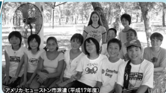
アメリカ・ヒューストン市派遣(平成17年度)

千葉市の姉妹都市カナダ・ノースバンクーバー市とアメリカ・ヒューストン市への青少年交流事業における派遣生を募集します。希望される方は、電話で申し込みのうえ、下記説明会に参加して下さい。