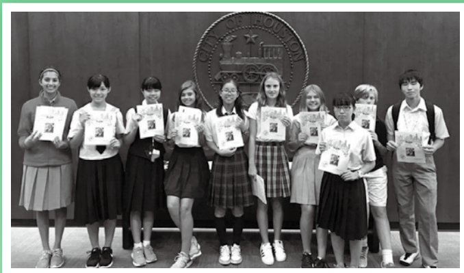
ヒューストン市派遣

次代を担う青少年に姉妹都市の文化・歴史等について理解をもらうため、青少年交流事業を実施します。