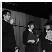
派遣生からの報告