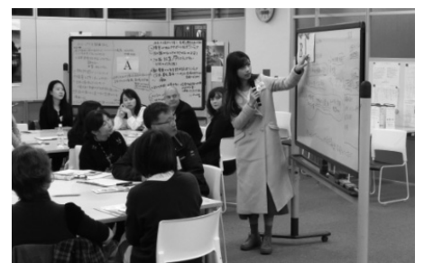
外国人市民懇談会

国際交流プラザでの業務の補助や、各種講座への参加、外国人利用者へのインタビュー等を通じて「国際交流」を体験してもらいました。