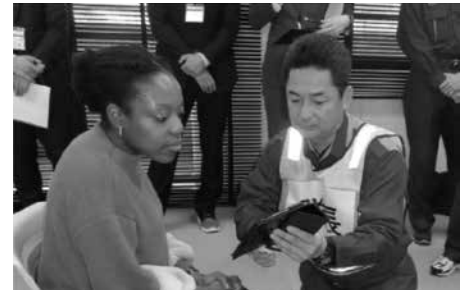
翻訳アプリの実践

外国人ボランティアが、交通事故等を想定した訓練に協力しました。翻訳アプリやジェスチャーで症状の聞き取りをする隊員達に、「丁寧に細やかな対応」、「母国語での声かけは安心する」等のほか、文化的違いを背景に、今後の対応に活かせる意見が出されました。