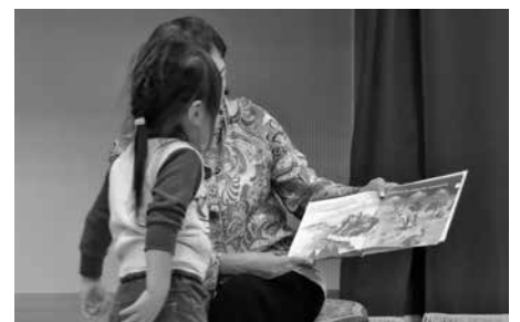
絵本の読み聞かせ

10月9日(火)都賀コミュニティセンター、12月4日(火)蘇我コミュニティセンター