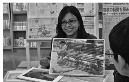
高洲第二中学校にて

中国にルーツを持つ方が多数住んでいる地区の公民館で、紙芝居やゴミ分別の理解を深めてもらうためのクイズを行いました。