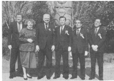
トーテムポール贈呈式