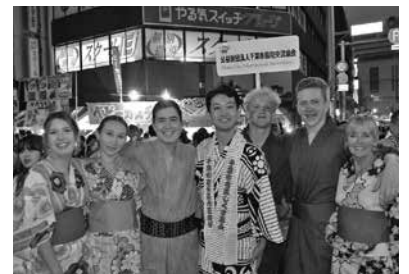
親子三代夏祭り(2018年)