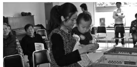
ゴミ分別のクイズ

千葉市役所職員を対象として、「やさしい日本語とは何か」の講義と、外国人市民を交えて「やさしい日本語」を作成するワークショップを開催しました。