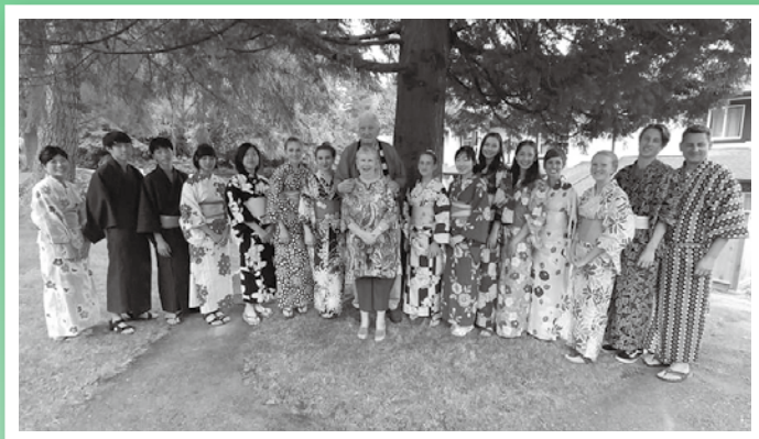
ノースバンクーバー市派遣