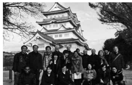
千葉市郷土博物館にて

子育て中の外国人保護者の悩みや不安を少しでも和らげるために、保育所に出向いて実施しました。