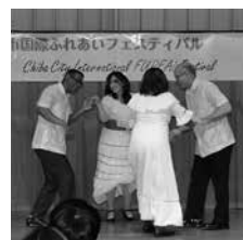
キューバダンスの披露

千葉市内で活動する国際交流・支援活動をしている21団体が日頃の活動を披露しました。また、昨年の夏に千葉市の姉妹都市(スイス・モントルー市、カナダ・ノースバンクーバー市)に派遣した高校生・引率者が、その報告を行いました。なお、皆様から頂いた寄付金及びバザーの売上金の一部は、千葉県ユニセフ協会を通じ「シリア緊急募金」として、支援が必要なシリアの子どもたちのために役立ちます。