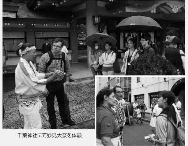
千葉神社にて妙見大祭を体験

その中でやはり一番理解できたことは、この短い間の中でも、言語の違いという異文化接触の最大の壁は、すぐ乗り越えることができるということでした。現地の人々の日常生活に入りこむことによって、ホスト・ゲストという区別がなくなり、ジェスチャーや片言でも会話が成り立つようになります。その際に、個々で人をみて自分の行動を調整しながら諦めず接するということは、少しのトレーニングがあれば誰でもできることなのです。そして、それが創生を成功させる鍵なのではないでしょうか。今まで千葉市では観光客向けに特別に開発した商品やイベントなどの交流の場を通して文化間の相互理解を目指してきました。今度は「何か」を通してではなく、「ありのまま」の千葉を経験してもらうのはどうでしょうか?「もてなす」のではなく、「一緒に過ごす」という協働のアプローチの利点は、地域(再)創生における異文化間相互理解において、やはり大きいようです。