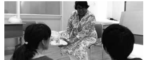
多文化理解セミナー