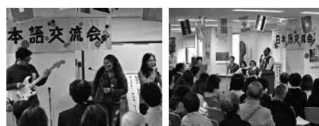
フィリピンの歌を披露