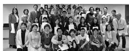
発表者とボランティアの皆さんで