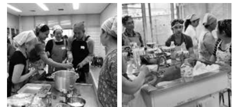
いろいろな国のカレーをつくって食べよう!!