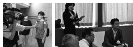
市美術館にてテレビ局取材の様子