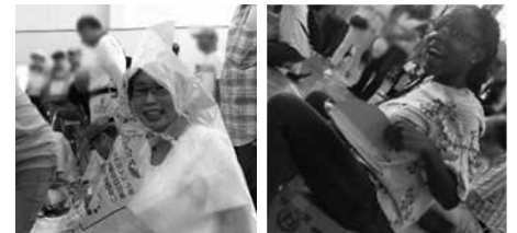
防災訓練参加キャンペーン