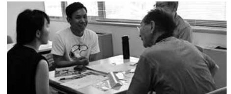
日本語活動ペア実践交流会

協会職員を講師として、ピンインや四声を学んだほか、家族や食べ物等についての会話を練習しました。