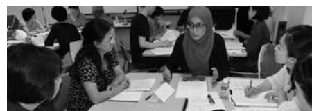
英語通訳演習の様子