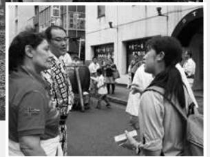
出会った市民にインタビュー