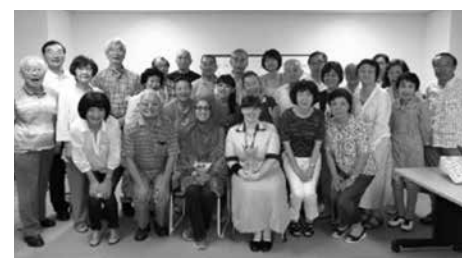
講師と受講者の皆さん