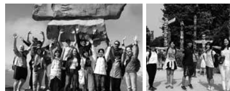
ウィスラー・マウンテンにて