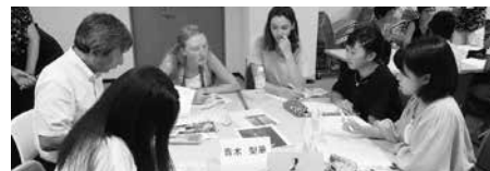
高校生通訳演習の様子