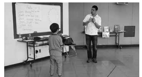
英語で挨拶の練習