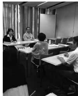
会長・スタッフとの質疑応答にも熱が入ります