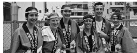
「親子三代夏祭り」にて