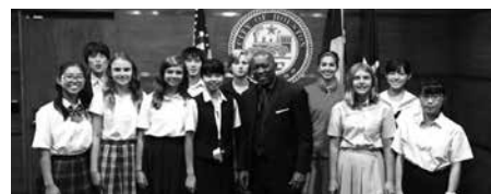
ヒューストン市長表敬訪問