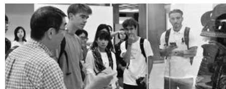
郷土博物館にて鎧の説明通訳