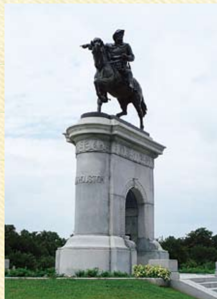
ハーマンパークのサム・ヒューストン像