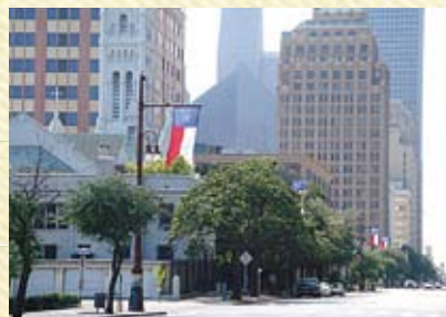
最先端かつ緑豊かなヒューストン市の町並