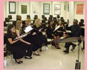
合唱隊練習の様子