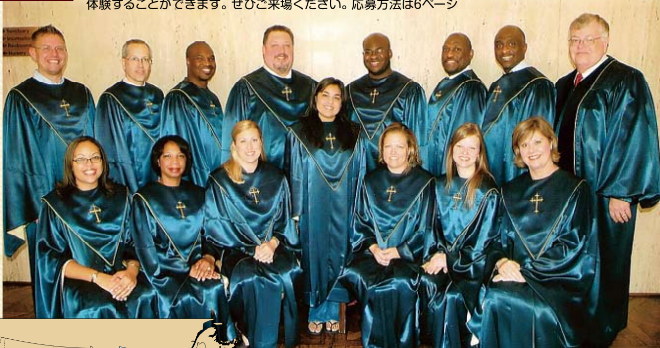
ヒューストン合唱隊(ゴスペル合唱メンバー)

今年はアメリカ合衆国・ヒューストン市から、ゴスペルとカントリーミュージックのグループが来葉し、歌と音楽を披露してくれます。心の奥底まで響くゴスペル、思わず踊りだしたくなるカントリーミュージックを体験することができます。ぜひご来場ください。応募方法は6ページ