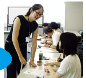
特典例：英語サロン(賛助会員限定講座)

賛助会員の方で「ふれあい」を次号より、E-mailでの送付を希望される方は協会(下記宛先)までご連絡ください。