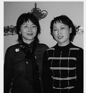
学習者の方と一緒に