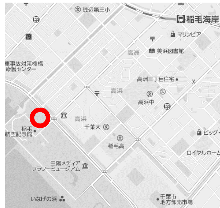
○ 防灾训练 本协会展位图